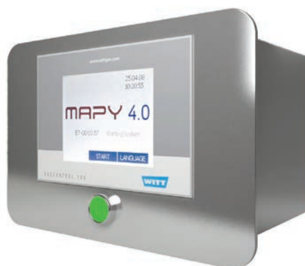
Съемный модуль MAPU